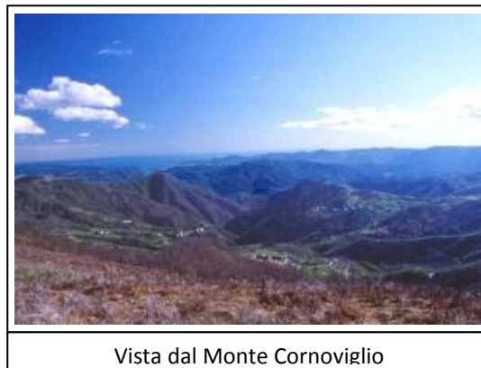
Vista dal Monte Cornoviglio

In prossimità del versante Sud/Ovest del M. Cornoviglio consigliamo una piccola deviazione. Infatti, percorrendo un breve ma ripido stradello si raggiunge la vetta del Monte (1165). Dalla sua sommità sarà possibile osservare il golfo di La Spezia e la costa ligure/toscana, la verde valle di Usurana, le rocciose Alpi Apuane, i dossi montuosi che precedono il Monte Gottero e tutta quella varietà di paesaggi che caratterizzano il territorio della Lunigiana. Tornati sui propri passi, senza eccessiva fatica raggiungiamo il Passo dei Casoni dal quale è possibile ridiscendere a MontereGGio (il Paese dei Librai e del Canto del Maggio) o proseguire sull'Alta Via verso il Passo del Rastello.